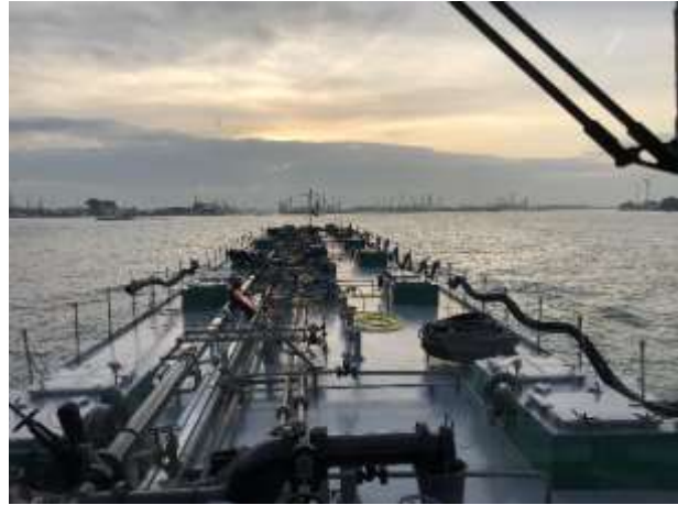
Es geht wieder zu Berg mit 500 t Sonnenblumenöl für Neuss

Über die alte Maas und mit der Flut fahren wir mit fast 20 Km/h zu Berg. Über Dordrecht und Gorinchem erreichen wir den Übernachtungshafen von Haaften und machen längsseits eines grossen Frachters fest um 23.30 Uhr fest. Im Anschluss heisst es sofort ab ins Bett, Tagwache ist morgen bereits wieder um 05.00 Uhr!