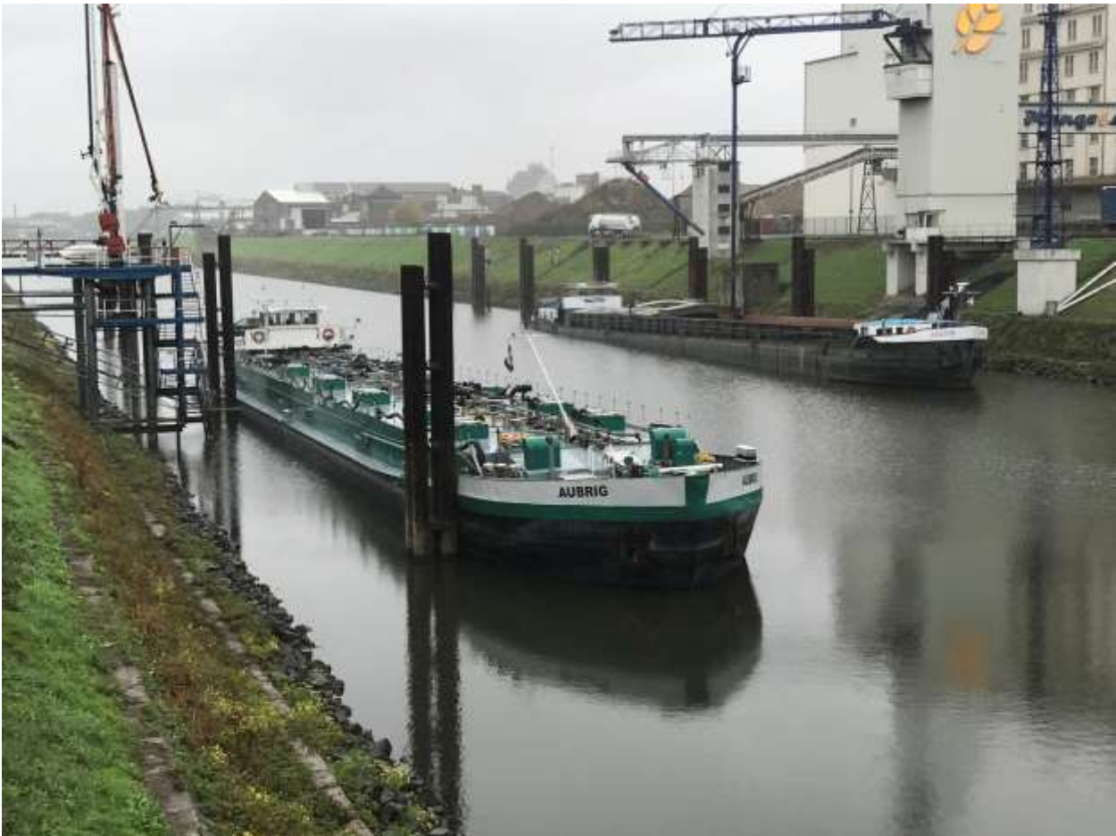
Bereit zum Löschen in Neuss bei Walter Rau

Um 19.00 Uhr sind die 500 Tonnen Sonnenblumenöl draussen und wir haben Feierabend. Im Anschluss verholen wir den Tanker auf den Wartesteiger, wir werden erst am Freitag hier in Neuss Rapsöl für Rotterdam laden. Eigentlich wollte ich noch ein Bier trinken gehen, aber es regnet mal wieder in Strömen! Das Bier trinke ich an Bord und schaue dazu etwas in den Fernseher.