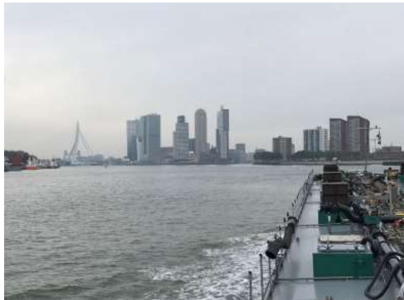
Rotterdam, die Stadt meiner Träume