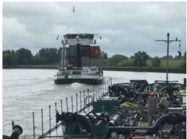
Autotransporter / Containerschiff

Unterhalb von Duisburg, am Luftball gehen wir um 22.00 Uhr vor Anker, heute spielt ja noch die Schweizer Fussball Nationalmannschaft gegen Irland, hoffentlich gibt es mal wieder einen Sieg für uns!