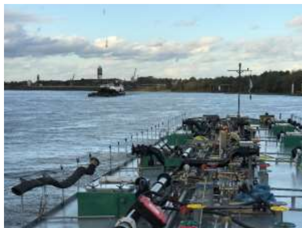
Ladestelle bei Sels in Neuss / Schuber zu Berg mit 2 Schubleichtern

Neuss. Mit 18 Km/h fahren wir zu Tal, morgen sollen wir in Rotterdam löschen. Somit ist bereits jetzt klar es wird heute mal wieder etwas später. Wir passieren Duisburg und bereits im Dunkeln die deutsch – niederländische Grenze. Der Verkehr ist immer noch enorm, die grossen Schubverbände, die grossen Tanker sowie die Containerschiffe haben alle doppelte Besatzung und fahren sowieso rund um die Uhr. Wir dürfen 16 Stunden fahren, somit fahren wir um 24.00 Uhr in den Übernachtungshafen von IJzendoorn und machen hier längsseits eines Frachters fest. Bis ich ins Bett komme wird es 01.00 Uhr. Gute Nacht und schon wieder ist schnelles schlafen angesagt!