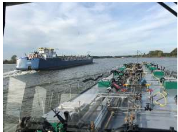
Puttershook / ein Küstenmotorschiff überholt uns

Kurz nach 17.00 Uhr kommt das Telefon, wir können jetzt auf den Löschsteiger fahren. Um 18.00 Uhr machen wir fest, der Kontrolleur kommt ebenfalls und nimmt seine Proben. Ich muss mich bei der Vopak Botlek melden und wieder einmal Papiere und Sicherheit Checks für das Löschen gemäss den geltenden Standards ausfüllen. Um 20.00 Uhr läuft im Maschinenraum die Pumpe an und das Rapsöl wird in die Tanks der Vopak gepumpt. Es wird somit wieder sicher wieder 03.00 Uhr bis wir fertig sind und die Ladetanks müssen im Anschluss auch noch auf Vordermann gebracht werden, am Montag werden wir dann wieder Sonnenblumenöl in Amsterdam laden!