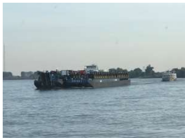
Containershipf / Autotransporter