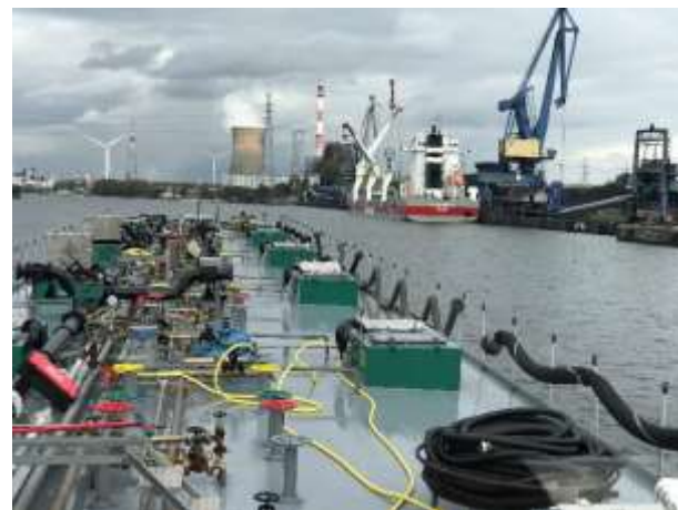
Viel los im Hafen von Gent