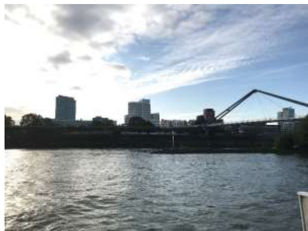
LKW Transporter / die schiefen Häuser von Düsseldorf