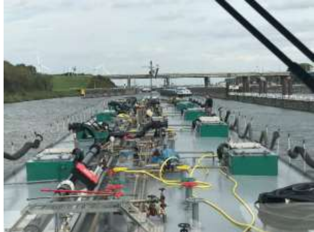
Krammersluis / Volkeraksluis