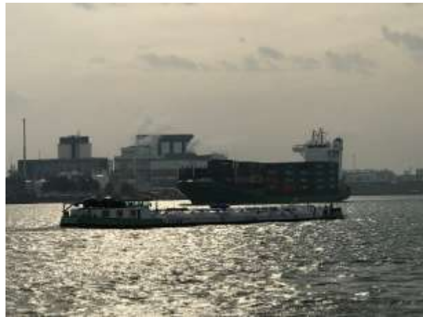
Wir sind mal wieder im KW – Hafen und warten auf das Laden