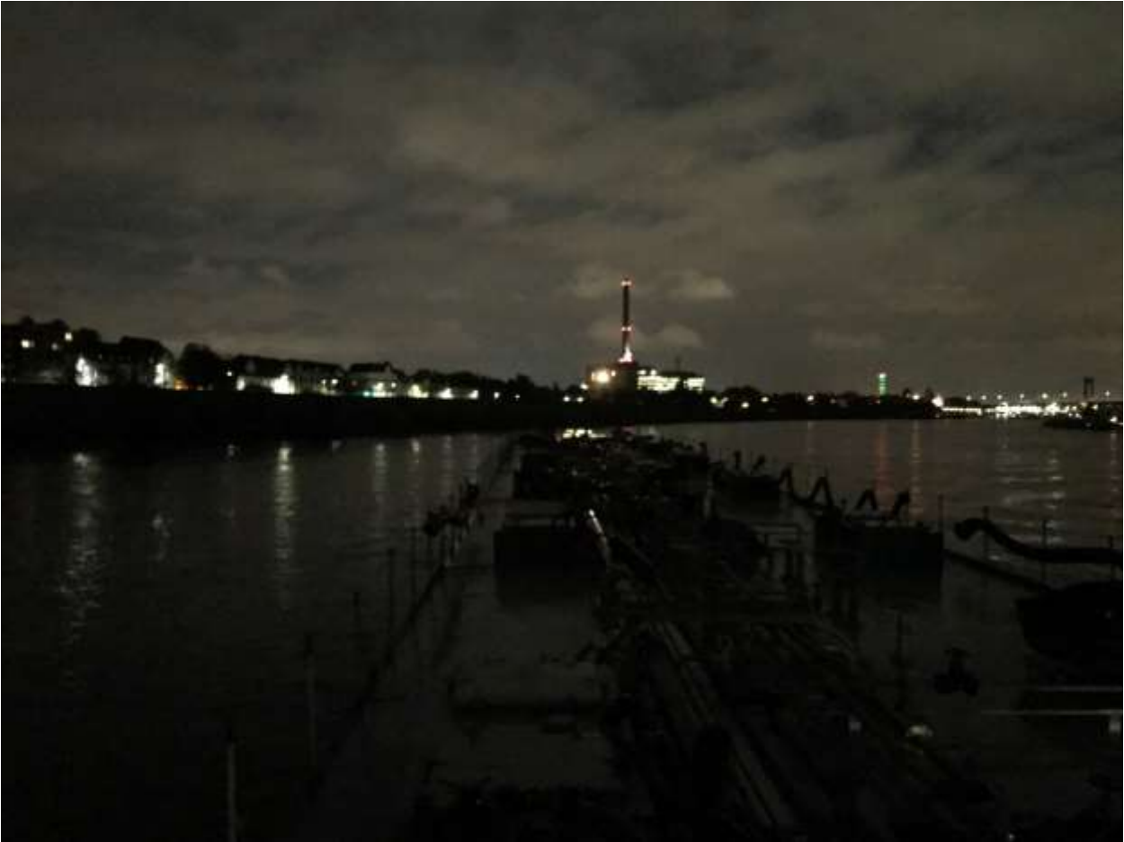
Vor Anker in Duisburg am Luftball

verband überholt den Anderen und zu Tal kommen auch noch mehrere Schiffe, gut wenn immer alles klar geht. Ab und zu werden schon ein paar Freundlichkeiten über den Funk ausgetauscht, man sagt sich dann wie gern man sich hat, aber im Grossen und Ganzen geht alles ganz ruhig und gesittet über die Kommandobrücken. Über Düsseldorf erreichen wir den Hafen von Neuss und machen bei unserer Löschstelle um 13.00 fest.