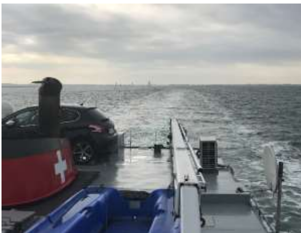
Schleuse Hansweert / Oesterschelde