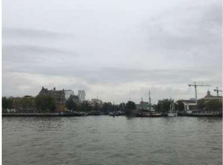
Euromast / Parkhafen