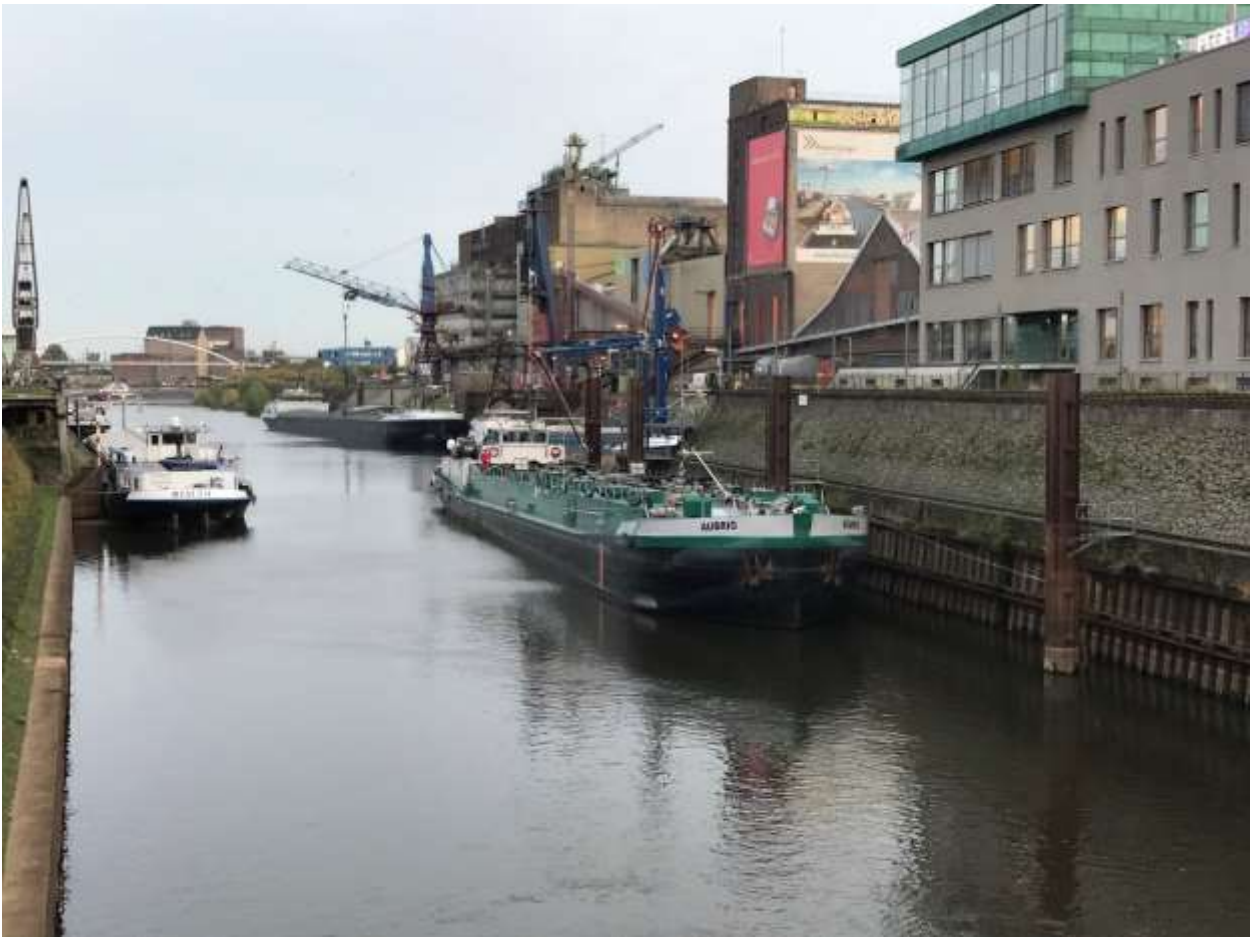
MTS Aubrig auf dem Löschsteiger der Firma Thywissen