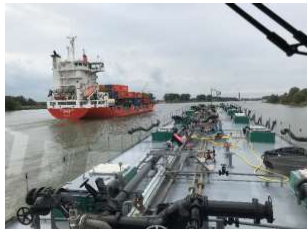
Dordtsche Kil / Seeboot überholt uns auf der alten Maas