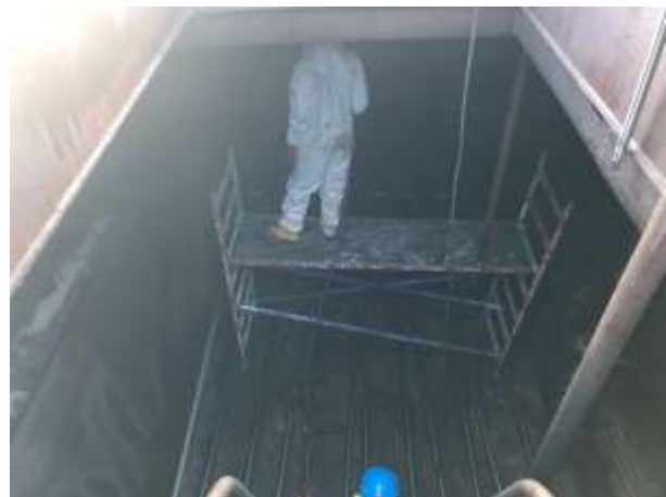
Meine polnische Besatzung / die Reinigung geht weiter

Um 20.00 Uhr gibt es Feierabend, 5 Ladetanks sind fertig und sauber. Wenn wir morgen fertig werden sollen, braucht es morgen schon noch etwas mehr Einsatz von der Reinigungsequipe!