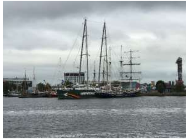
Anfahrt auf Amsterdam Centrum