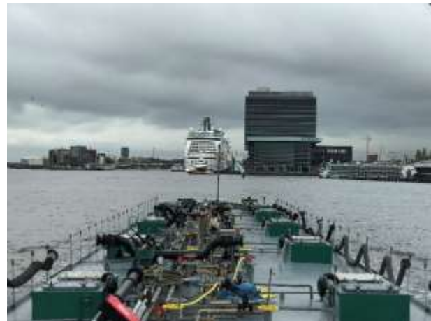
Central Station Amsterdam / Kreuzfahrtschiff

Wir passieren Amsterdam, bei der Central Station fahren bekanntlich sehr viele Fähren, hier heisst es nun ganz besonders aufmerksam zu sein. Etwas später erreichen wir wieder dem Amsterdam – Rheinkanal, welchem wir nun bis Tiel folgen. Bevor wir den Rhein resp. die Waal erreichen müssen wir zuerst die Irene Schleuse sowie die Schleuse von Tiel passieren. Natürlich