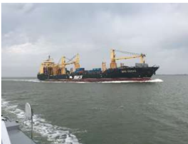
Terneuzen / Seeboot überholt uns vor Hansweert