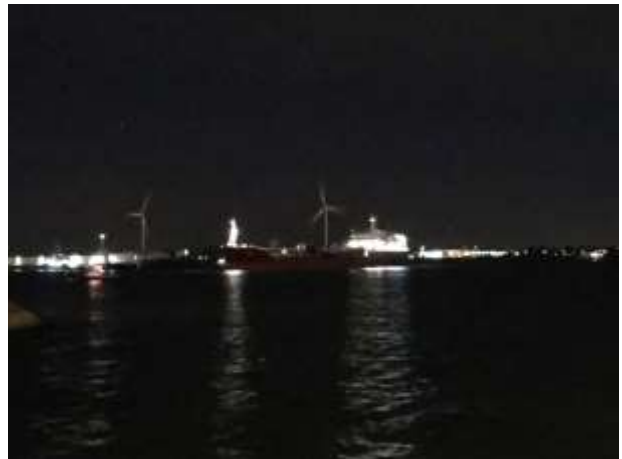
MTS Aubrig auf dem Löschsteiger / Einlaufende Seeboot, es läuft immer etwas in Rotterdam