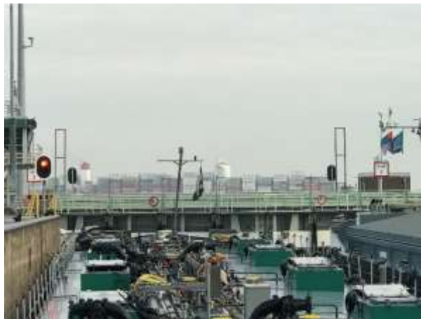
Anfahrt auf die Schleusen von Terneuzen / Containerschiff fährt vor der Schleuse durch