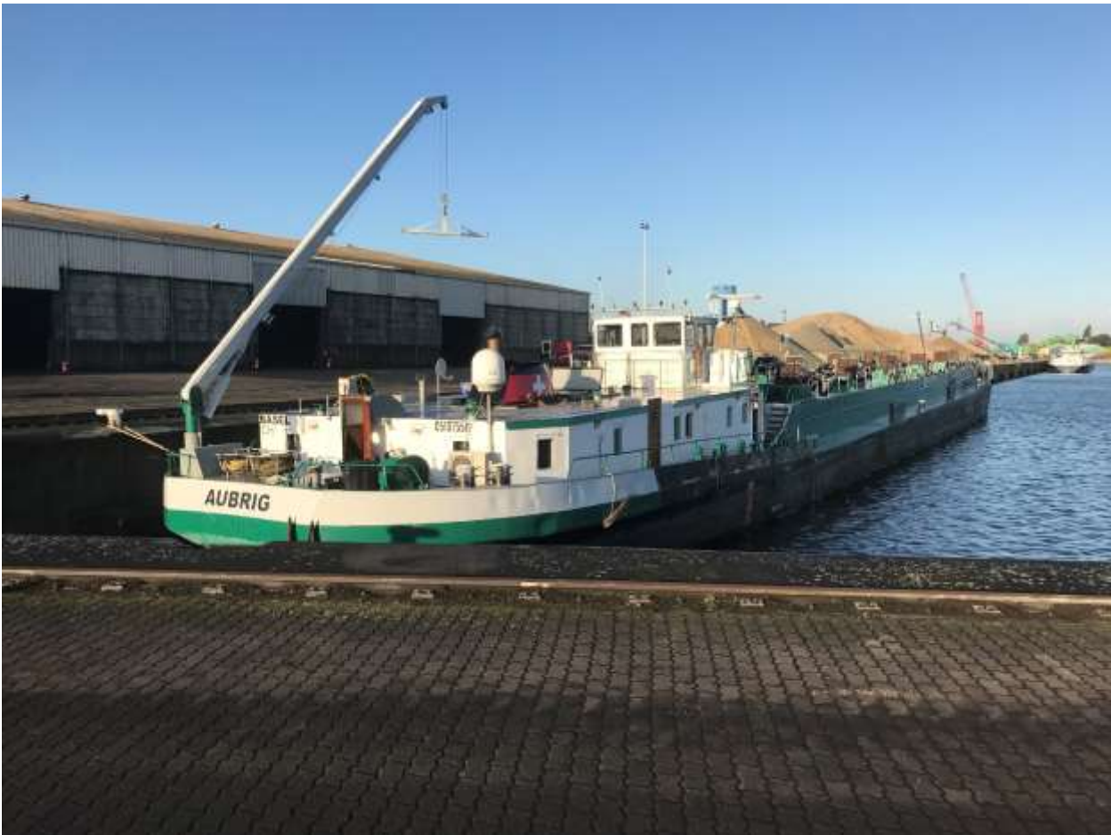
MTS Aubrig m Zuiddok

Wir liegen nach wie vor in Gent, im Zuiddok und die Reinigungsarbeiten gehen heute den ganzen Tag weiter. Wenn alles gut geht, werden wir am Freitag fertig, für mich keine spannende Angelegenheit! Ich habe aber schön Zeit, für meinen deutschen Sportbootführersee zu lernen.