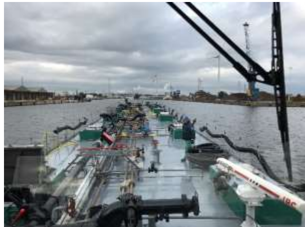
Endlich fertig in Gent / wir sind wieder unterwegs Richtung Rotterdam

resp. wie immer, konzentriert ans Werk gehen. Nach etwa 2 Stunden machen wir nach der Zalzatebrücke wieder fest, hier müssen wir uns auch aus Belgien abmelden. Da wir erst am Montag laden müssen, gibt es keinen Grund in der Nacht die Schelde zu befahren. Ich lasse mir Zeit, bis zur Schleuse Terneuzen werden wir noch ca. 1 Stunde unterwegs sein und wenn alles klappt fahren wir um +/- 10.00 Uhr auf die Schelde, hoffentlich bei bester Sicht und wenig Seefahrt!