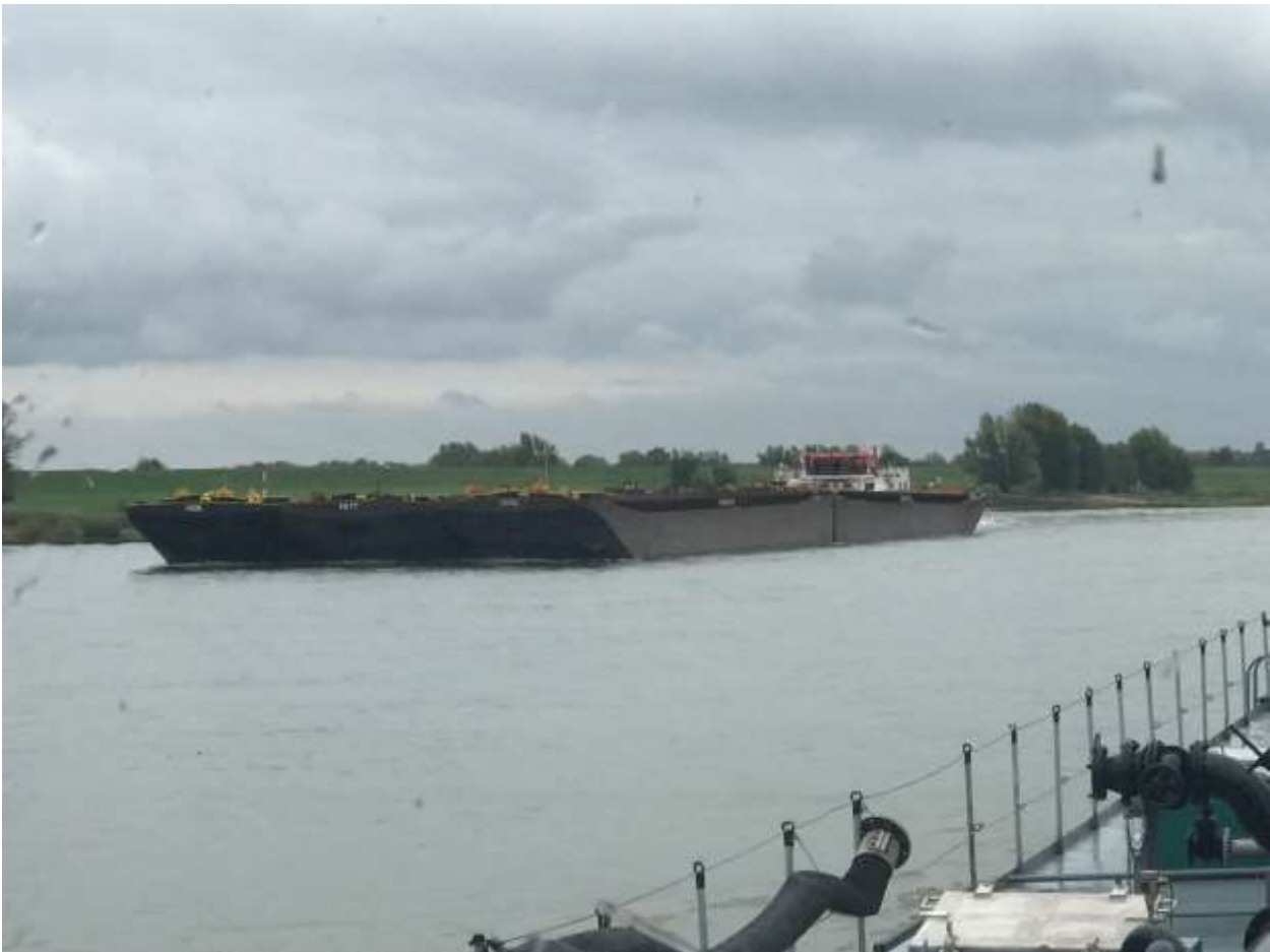
Schubboot mit 6 Schubleichter zu Tal, geladen +/- 16000 t