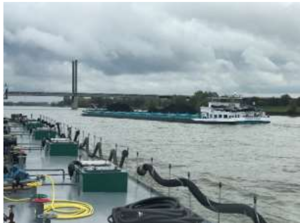
Somtrans LNG, 135 m x 22 m 12652t / Frontera 135 m x 15 m 5888 t