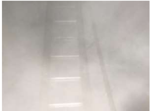
Blick in die Ladetanks während der Feinreinigung, zwei Männer sind im Ladetank