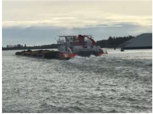
Schuber mit 6 Schubleichtern, er schieb ca. 16000 t zu Berg