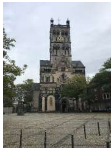
Quirinus Basilika zu Neuss