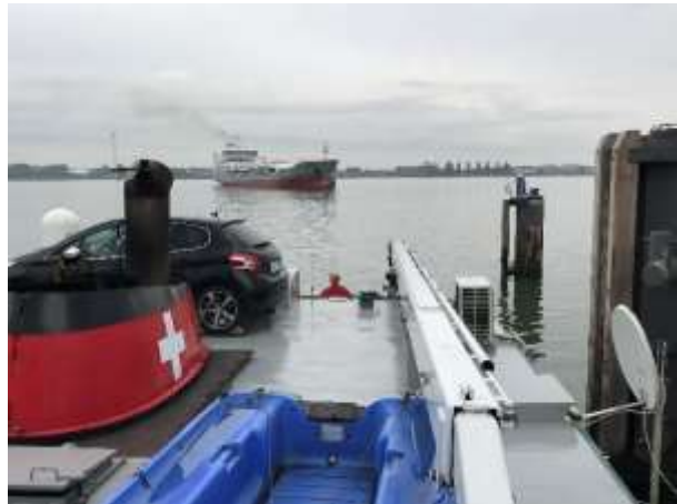
Einlaufende Seeschiffe in den Botlek

Anstatt um 03.00 Uhr sind wir dann erst um 08.00 Uhr fertig und alle an Bord sind mehr als nur müde. Ich schicke meine beiden Besatzungsmitglieder bis um 12.00 Uhr ins Bett! Da wir ja erst am Montagmittag in Amsterdam laden müssen, haben wir auch etwas Spielraum.