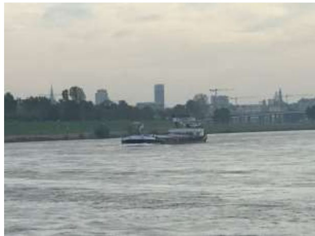
Düsseldorf / MS Rio Grande

In Neuss fahren wir in den Hafen und machen im Anschluss im Hafenbecken 2 bei der Firma Walter Rau fest. Telefonisch melde ich uns an und um 15.00 Uhr pumpen wir die 875 t Sonnenblumenöl an Land.