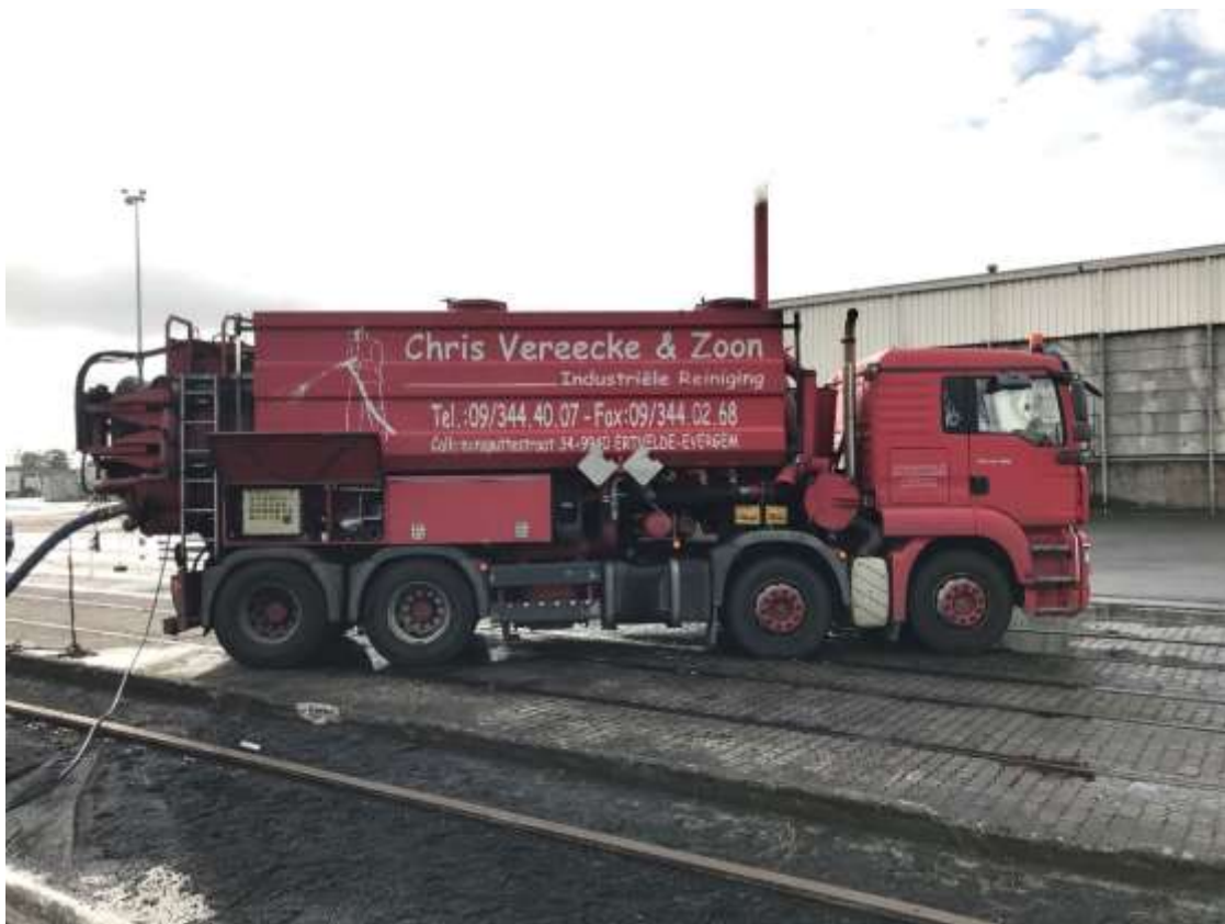
Pumpwagen zur Reinigung

ziemlich dicke Pampe hat sich auf dem Boden abgesetzt. Diese muss nun weggespritzt und danach umgehend abgepumpt werden! Wie lange diese Arbeiten dauern werden ist noch nicht