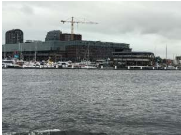
Dicke Seeboot am Löschen / Jachthafen Amsterdam

Wir laden im Anschluss 875 t Sonnenblumenöl, dass heisst nur ein LKW muss mit dem Rest unserer Ladung nach Neuss fahren. Um 15.00 Uhr legen wir ab und machen uns auf den Weg.