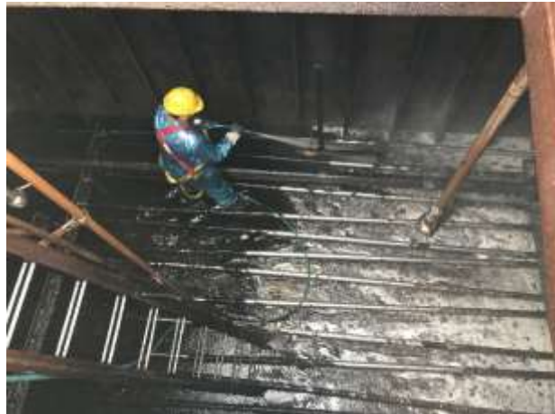
Ladetanks / am Sauber machen