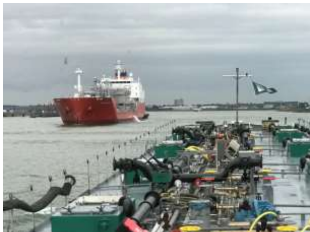
Botlekbrücken / Seeboot einfahrend in die alte Maas