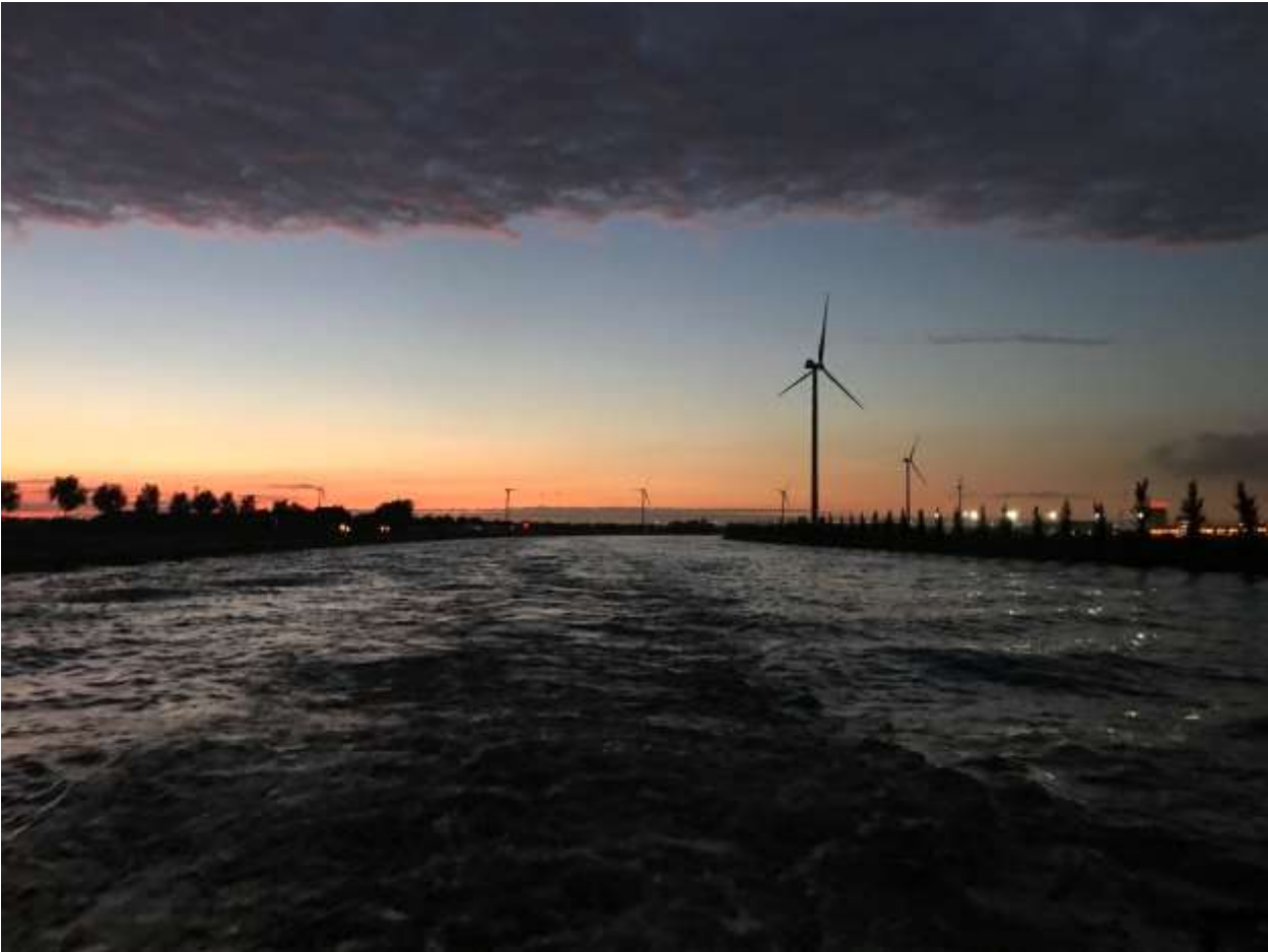
Abendstimmung im Amsterdam - Rheinkanal

kommt als ich in Tiel auf die Waal fahre einen Schubboot mit 6 Schubleichtern zu Tal! Kein Problem er macht mir etwas Platz und die Begegnung ist Steuerbord – Steuerbord! Feierabend machen wir, um 23.00 Uhr mal wieder in IJzendoorn, wir sind mittlerweile ein guter Kunde hier im Übernachtungshafen. Zum Glück verursachen diese Übernachtungen keine Kosten!