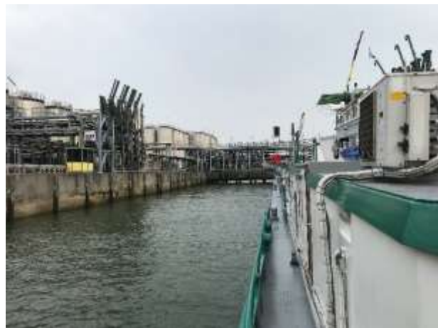
Ladestelle beim bei Vopak in Vlaardingen

nur 500 Tonnen, bezahlt werden wir aber für 1000 Tonnen, das passt so doch auch ganz gut. Um 17.30 Uhr sind wir fertig und um 18.00 Uhr können wir wegfahren! Wegfahren ist gut, in der Einfahrt liegen jetzt 2 grosse Tanker. Rückwärts muss ich mich schon fast durchquetschen, es bleiben gerade mal 1 Meter auf jeder Seite und Flut haben wir auch noch! Es geht alles gut, mein Puls ist aber danach etwas höher als normal.